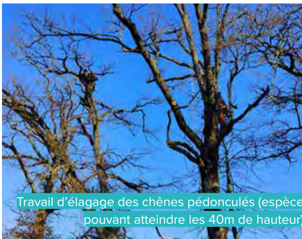
Travail d'élagage des chênes pédonculés (espèce pouvant atteindre les 40m de hauteur)