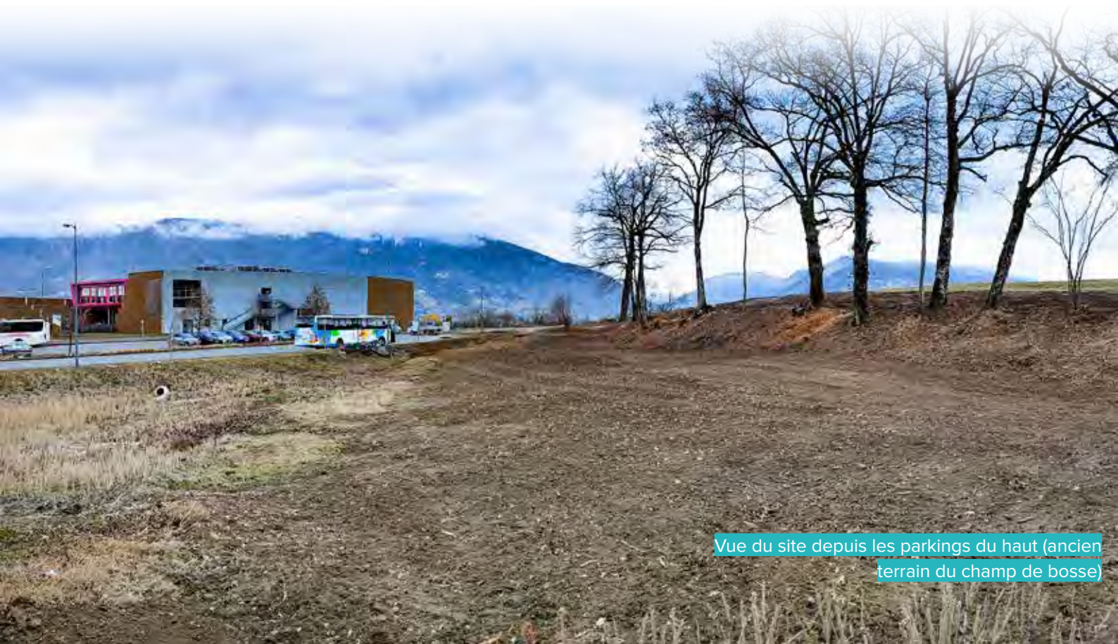
Vue du site depuis les parkings du haut (ancien terrain du champ de bosse)