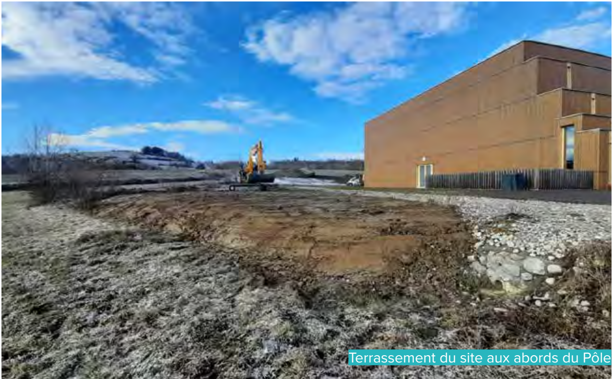
Terrassement du site aux abords du Pôle